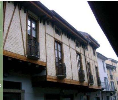
Cascina Casatenovo, LC