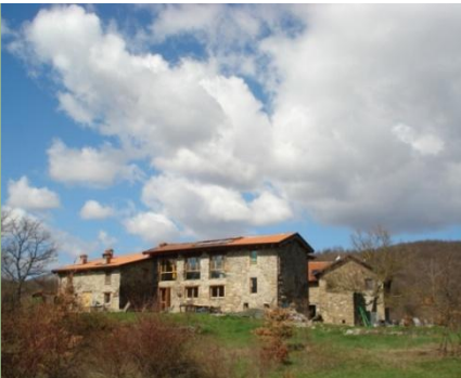
Ecovillaggio Granara, PR